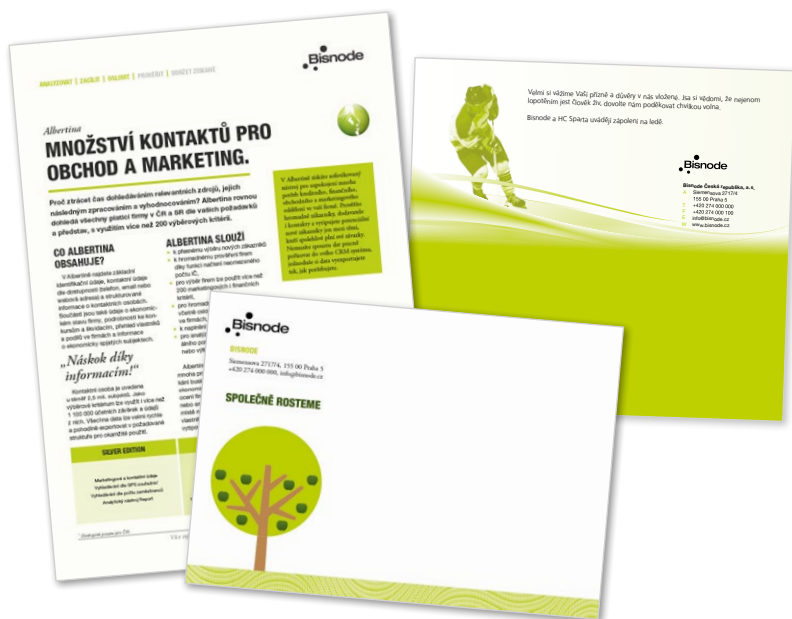
Direct Mailing Ukázky zpracovaných zásilek